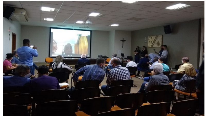
O CRM-ES buscou a união de forças, com os deputados estaduais, para ampliar a fiscalização das unidades hospitalares

Da mesma forma, foram denunciadas, ao Ministério Público, à Comissão de Saúde da Assembleia Legislativa e aos governos