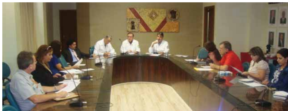
Reunião com o Grupo Unidas, na sede do Conselho, foi considerada proveitosa pela Diretoria do CRM-ES

A Diretoria do CRM-ES, reunida no dia 14 de abril com representantes do Grupo Unidas, cobrou um reajuste no valor das consultas médicas pagas pelos planos de saúde pertencentes ao grupo. O valor atual, que é de R$ 40,00, deverá