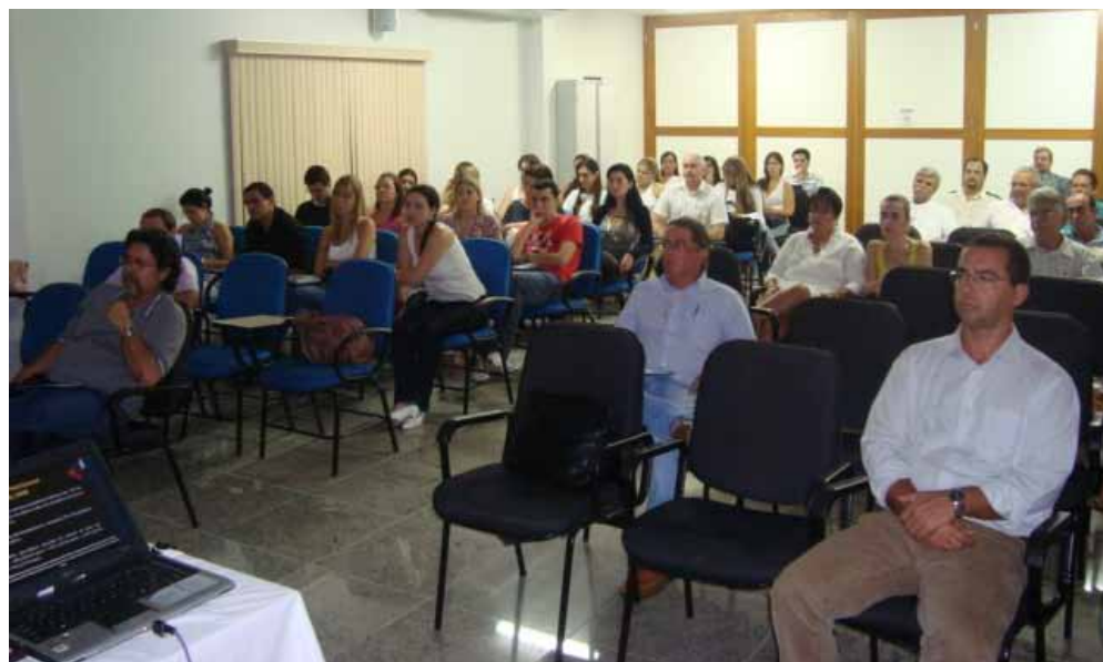
Aula do PEC ministrada em São Mateus, no auditório do Norte Palace Hotel, dias 15 e 16 de abril deste ano

Os palestrantes do PEC são professores da Emescam, da Ufes e também representantes das sociedades de especialidades médicas. Eles abordarão temas relacionados às necessidades de cada região onde serão realizados os módulos do programa. O PEC também contará com módulos do curso Fundamental Critical Care Support (FCCS), aplicado pela Sociedade Espírito-Santense de Medicina Intensiva (Soesti).